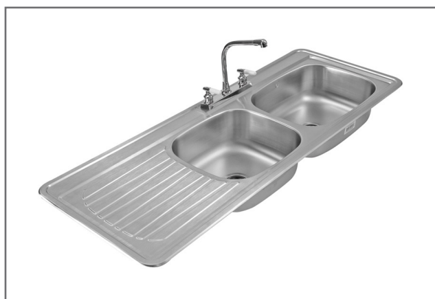
C-211N - Escurridero lado izquierdo C-212N - Escurridero lado derecho