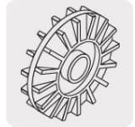
Impulsor de nylon