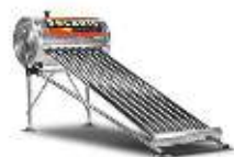
8 tubos 2 personas | 84 litros