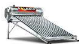
15 tubos 4-5 personas | 173 litros