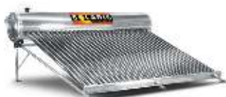
30 tubos 8-9 personas | 340 litros