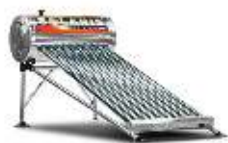
10 tubos 3 personas | 130 litros