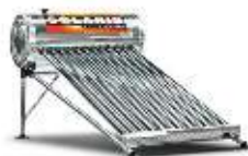
12 tubos 4 personas | 150 litros