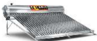
30 tubos 8-9 personas | 340 litros