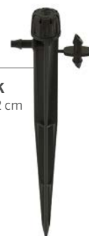
SD-B-STK Altura: 15,2 cm