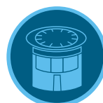
Boquillas de microaspersores de radio corto

Para un sistema de riego localizado aéreo más robusto, utilice las boquillas de riego localizado de radio corto con cuerpos difusores Pro-Spray: