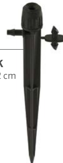
HS-B-STK Altura: 15,2 cm